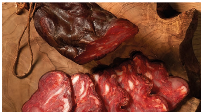
← Salpicão de Vinhais

Zona de producción en la Reserva: Alfândega da Fé, Bragança, Carrazeda de Ansiães, Macedo de Cavaleiros, Mirandela, Vila Flor y Vinhais.