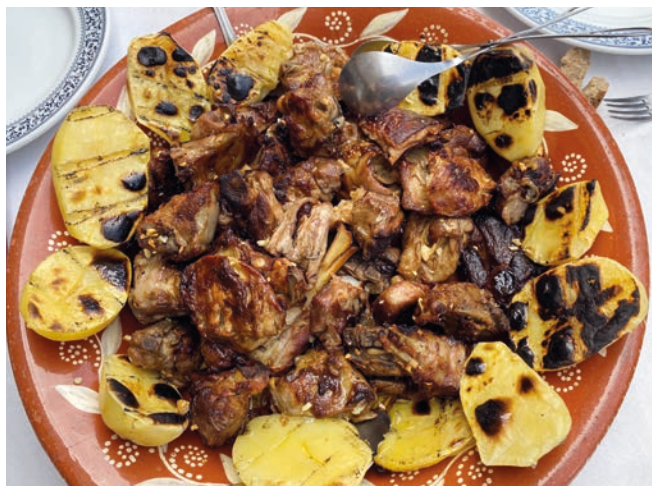
← Cordeiro Mirandês

terminados con tres o cuatro meses de edad, nacidos y criados en un sistema de explotación extensiva tradicional. Es una carne muy tierna, particularmente succulenta, suave, y una grasa consistente y no exudativa. El peso medio del canal estimado estará entre 10 a 12 kg.